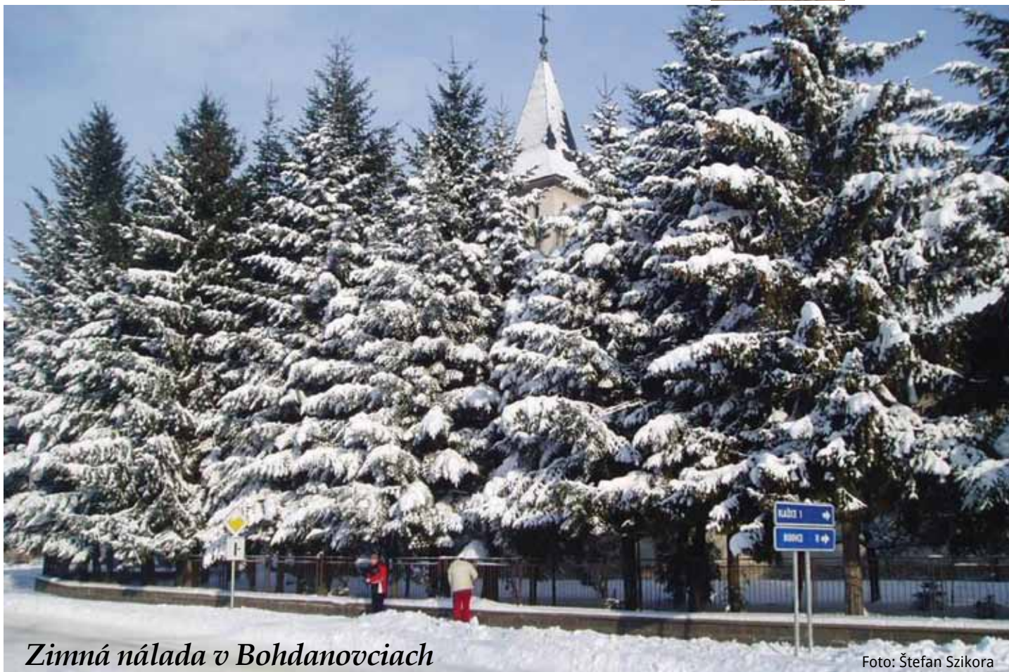
Zimná nálada v Bohdanovciach